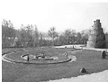
スパイラルスプリング水の広場