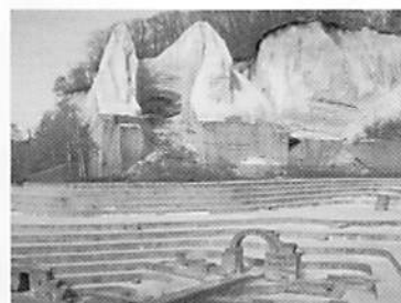
ネガティブマウンド石の広場